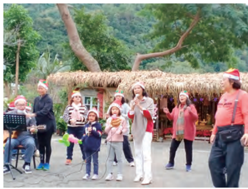
▲親子共融歡唱聖誕音樂會，向遊客傳報救主耶穌降生的喜訊。