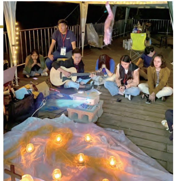
▲在泰澤祈禱的靜默中，用心感受天主的臨在。 ◀在溫馨的天學園地裡，我們在主內合一共融。

邁入第10年的輔仁大學天主教研修學士學位學程，安排迎新宿營，一來歡迎新生，希望讓新鮮人盡快融入學程及校園生活的氛圍，拉近舊生與新生的距離，在主內共融，攜手活出主耶穌的教導，在校園內成為福音生活的見證。基於共同的信仰，有天主聖神的帶領，加上學長姊用心，身心靈豐收。