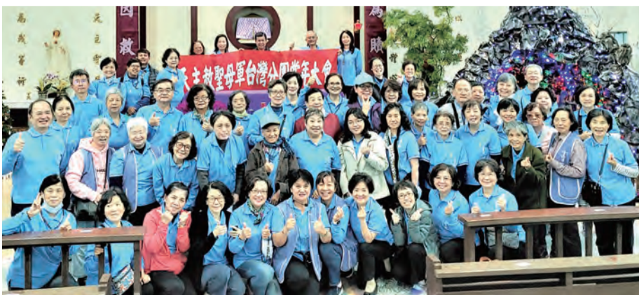
▲在台灣分團軍友彰化聖十字天主堂祈禱之後合影留念

在回程中參訪彰化聖十字天主堂，對越南、菲律賓及中華文化三種不同風味的馬槽搭建讚揚不已，在3點整的慈悲串經同聲祈禱後，前往大溪晚餐共融，圓滿賦歸。