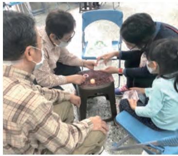
▲三代同堂誦念禱詞，闔家虔誠事主的畫面溫馨感人。