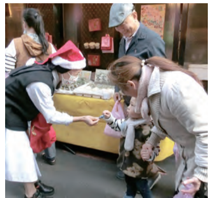
▲修女沿途發糖果，小朋友好開心。

內灣天主堂位於新竹橫山鄉內灣村最老的一條街的轉角上，內灣四面環山，老街上的建築物依山勢而建，海拔從350公尺緩緩升到火車站和內灣國小，大概是制高點，海拔將近1000公尺，左右兩邊的商圈就是下坡路段；內灣老街踩街報佳音活動，已經進入第4年，第1年請磐石中學青年會來支援活動時，造成轟動。因此，耶穌肋傷會修女年年預約磐石中學青年會團體，訂在聖誕節前的周六下午，邀請青年前來內灣踩街報佳音的福傳服務。