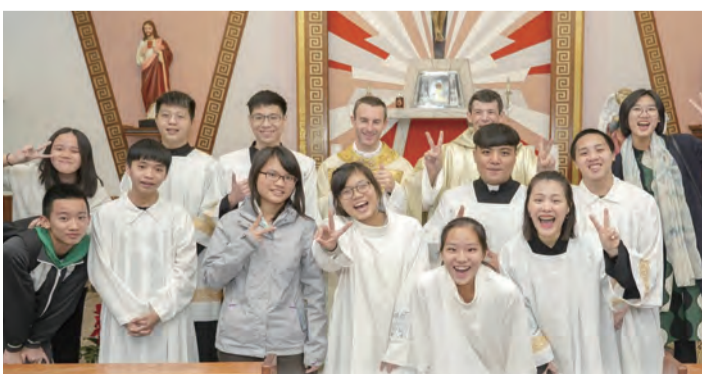
▲通化街玫瑰堂青年會於聖誕彌撒中透過服務，歡喜迎接耶穌誕生。

加入團體後，一起為國、高中青年的信仰陶成服務，漸漸地認識各教區的青年們，一起舉辦活動，並參與教區的大小營隊。陸續參加了「台灣青年日」、「亞洲青年日」及「世界青年日」等，在參與並學習同時，看見了教會在青年牧靈上的危機及可以更好的部分，因此更願