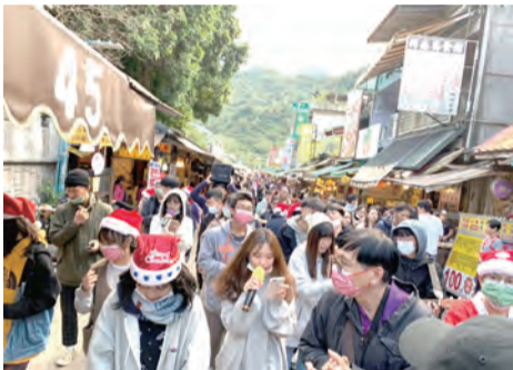
▲內灣天主堂創意福傳，熱鬧滾滾。