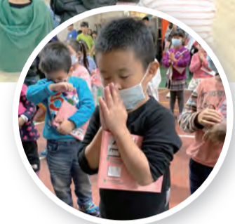
▲認真祈禱的孩子 ▲公館附幼師生喜樂合影

我們找到了迷路的羊。健康站主任也歡迎我們在未來可以持續再去陪伴這些可愛的長者們。