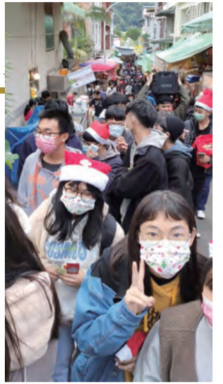
▲踩街隊伍活絡了整條老街。