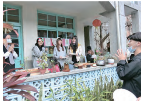
▲修女帶領還不是教友的磐石青年一起作飯前禱