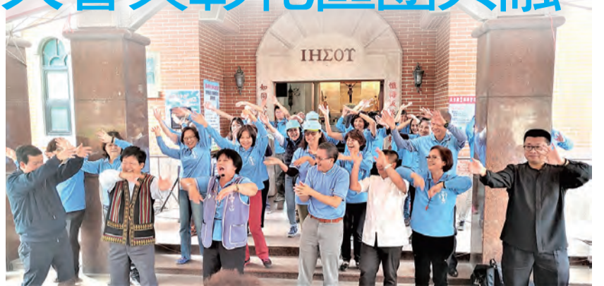
▲多位神長們也和台灣分團軍友一起歡樂跳唱 ▲台灣分團在美麗的百年教堂羅厝天主堂前大合照

聖母軍以「孝愛聖母、彰顯基督」為主題，慶祝在台灣成立70周年，從北到南遍地開花，有紀律、有成效地在全台各地結出豐碩果實；台灣分團在12月5日提前慶祝聖母始胎無原罪節而舉辦常年大會，特地選擇彰化埔心的百年教堂羅厝天主堂朝聖，並與彰化區團的慶祝70年活動感恩共融。