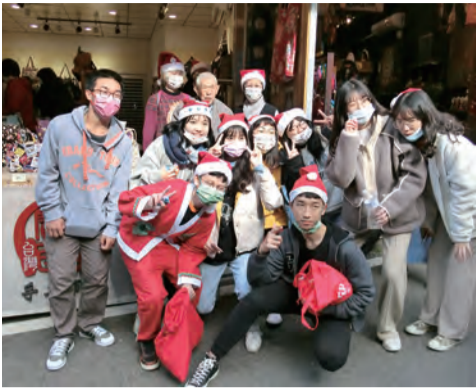
▲磐石青年雖不是教友，卻喜樂付出，滿心感謝豐收。