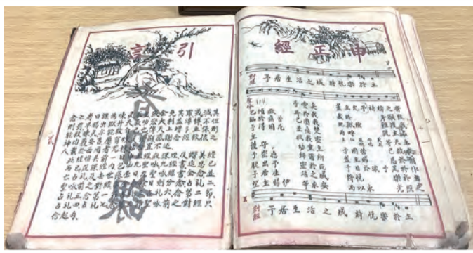
▲為亡者祈禱日課〈申正經〉（晚課）首頁