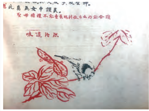
▲聖母小日課中的插畫