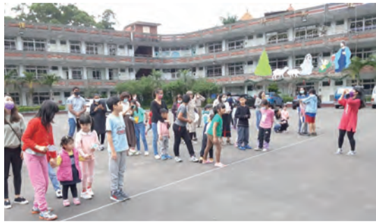
▲家庭信仰生活日活動以趣味競賽方式，讓親子在遊戲同時加深教理認識。

修女們一早便來到方濟中學的禮堂安排佈置場地，加上家長們的熱心相助，從排放桌椅、餐點準備、瑣碎準備工作等，一切妥善就緒。修女們用輕鬆說故事的方式，從《舊約·創世紀》中亞當和厄娃開始，連結到最後耶穌的誕生，以代表12個事件的12個圓型剪紙，拼貼成一顆「葉瑟樹」，開啟所有人對教理的新體認。從《舊約》