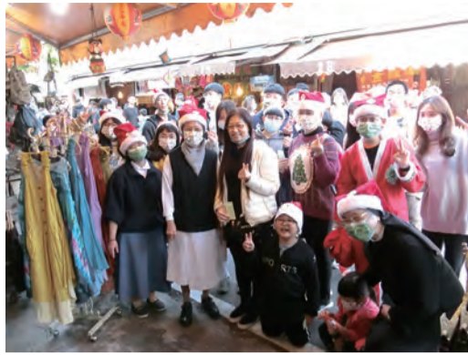
▲喜樂踩街報佳音，來到店家按個讚。