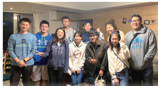
▲延吉街聖母顯靈聖牌堂青年會每月一次「家庭祈禱會」，以祈禱及信任作為凝聚不同世代的力量。

意帶著豐富的經驗回到堂區陪伴青年會，從堂區為起點，鼓勵青年勇敢走出去，再帶著充沛的收穫回到堂區耕耘，為福傳注入滿滿活力！