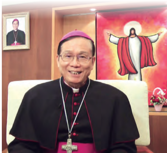
▲鍾安住總主教於聖誕前夕接受真理電台專訪，表達感恩和期盼，以及對天主子民的誠摯祝福。

因著主耶穌基督的誕生，12月給我們社會帶來了屬主的喜樂、平安及希望。首先，從教會的禮儀年曆來看，先是「將臨期」，將臨期一開始提醒我們要警醒，從平常忙碌