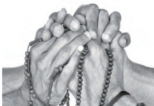
◀各宗教領袖交流討論青年道德培育的重要性。

信 德使信者在他人身上看到需要被支持和被關愛的弟兄或姊妹。天主創造了宇宙萬物及全人類（因祂的慈悲，人人皆平等），使信者因相信天主而受召去保護受造界及整個宇宙和支持所有的人，特別是那些最貧困和最有急需的人們，藉此表達此人類兄弟情誼。