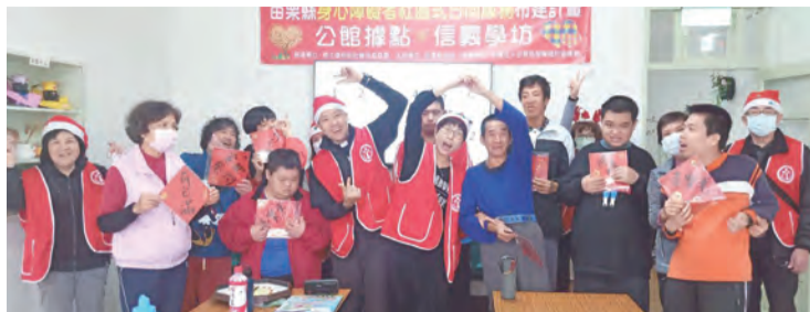
▲公館聖保祿堂報佳音隊伍與社區一起歡慶聖誕佳節。