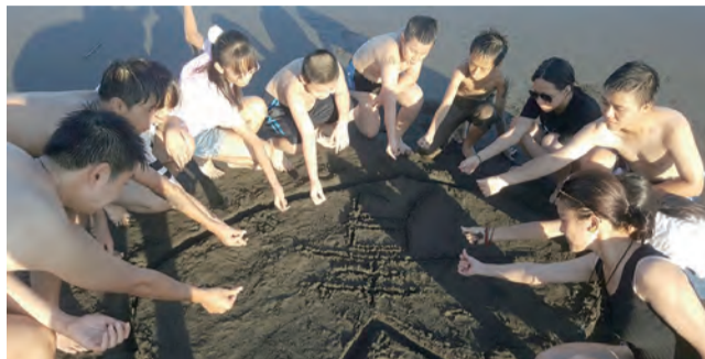
▲中和天主之母堂青年會海邊共融，齊心獻主愛。