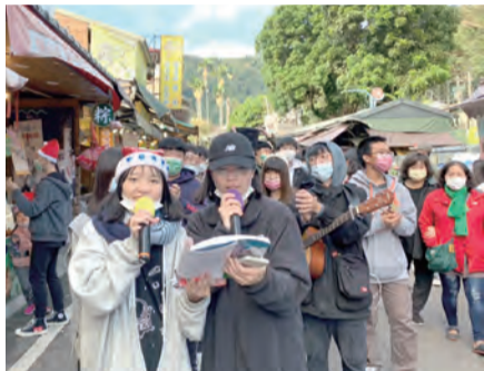
▲青年們報佳音留下難忘美好的體驗。